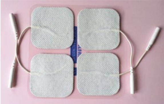
Ref.: AWN 2505 50X50mm PELICULA DE CARBONO / PLATA

DOBLE CAPA DE GEL DE LARGA DURACION PARA TRATAMIENTOS DE DOLOR CRONICO