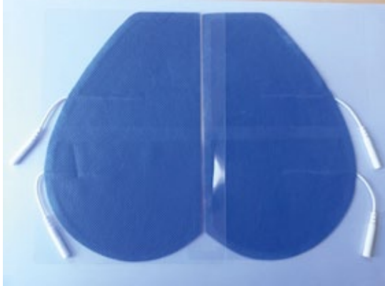
Rf a : CWN-1118 110x180mm.