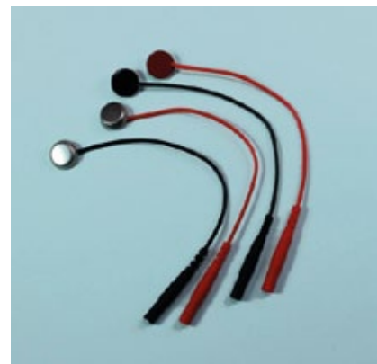
Rf a : 1212 ELECTRODOS FACIALES

Nuestros ELECTRODOS DE ESTIMULACION ESPECIALES distribuyen la corriente uniformemente, sin punto caliente. El GEL-LONGLIFE hace que sea auto-adhesivo, reutilizable y duradero.