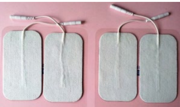
Ref.: AWN 2509 50x90mm PELICULA DE CARBONO / PLATA