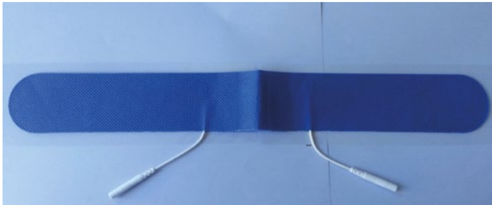
Rf a : DW-1613 40x330mm.